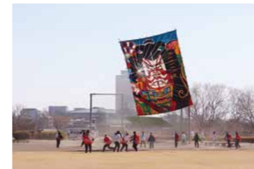
過去の凧揚げ大会の様子

前橋商工会議所青年部「緑水会」では、日本の伝統の遊びである「凧揚げ」を通じ、家族や友達とのコミュニケーションの場を作り、伝統的な遊びを次世代に継承していきます。 今年度は、恒例の大凧揚げやスタントカイトに加え、新たにジャポンボカイト揚げや新潟県三条市の三条凧による上州けんか凧を開催いたします。またキッチンカーも多数出店し