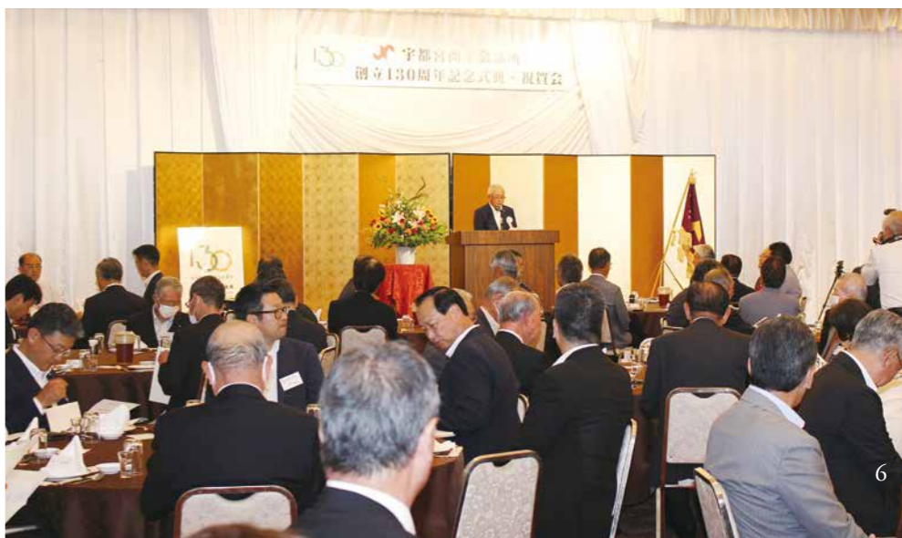
当所創立130周年記念式典祝賀会

本市だからこそ実現できる未来を先取りした新しいまちの暮らしを実感できるように、総合的な公共交通ネットワークの要となるライトラインをフル活用して、「NCC」の形成を加速化させていくとともに、