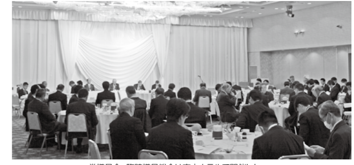
常議員会・臨時議員総会は市内ホテルで開催した

公正中立な公的機関として、中小企業の実態、ニーズに合わせて幅広く支援策を用意しています。秘密は厳守しますので、お早めにご相談ください。ご相談は、事前に電話でのご予約をお願いします。