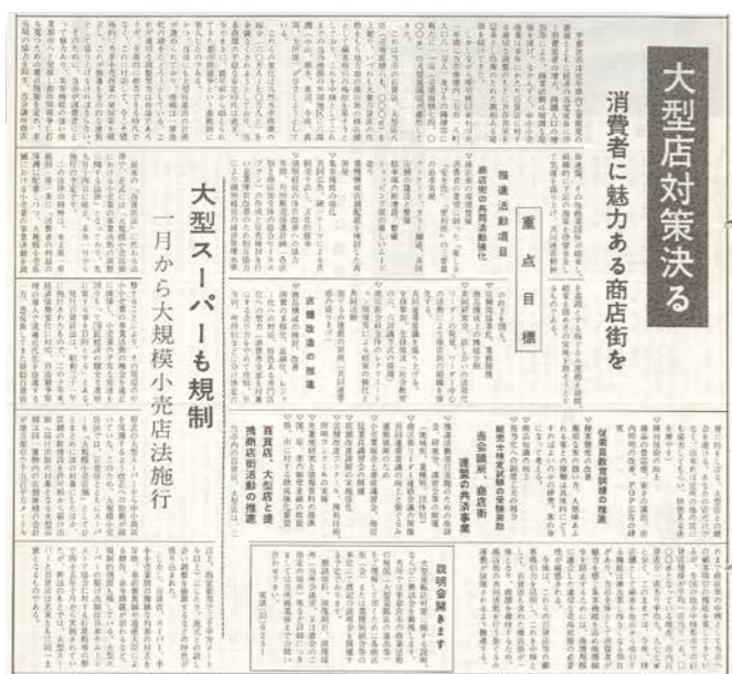
117号「大型店対策決る 消費者に魅力ある商店街を」

宇都宮市の商圏には昨秋から一年の間に 11店もの大型店が進出。これらによつて当 市商圏の縮小を余儀なくされようとして おり、今やまさに「都市間競争」と呼ばれ る激動期に突入した。 当市にも大型店進出の計画が進められ ている。今後、当市が消費者にとつて魅力 的で集客機能の強い商業都市として発展 し、都市間競争に打ち克つためには、重点 施策を定め、商工会議所や商店街連盟 その他商業団体が結束して対応しなけれ ばならない。