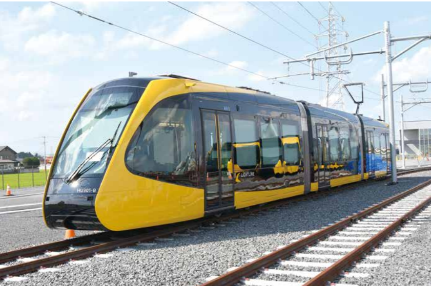
8月の開業以来全国から注目を浴びる芳賀・宇都宮LRT（通称「ライトライン」）

と感じました。また、沿線の風景、特にJR宇都宮駅東口周辺が大きく変わっていることが付きました。新しいビルやマンションなどが沿線に建っていて、活気を感じられました。一昨年にできた交流拠点施設「ライトキューブ宇都宮」もあり、大変賑やかになっていますね。これもライトラインの効果だと思えます。しかしライトライン開業後の活気を目的にすると、次は西側延伸を期待してまいりますね。