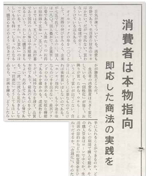
170号「消費者は本物指向 即応した商法の実践を」