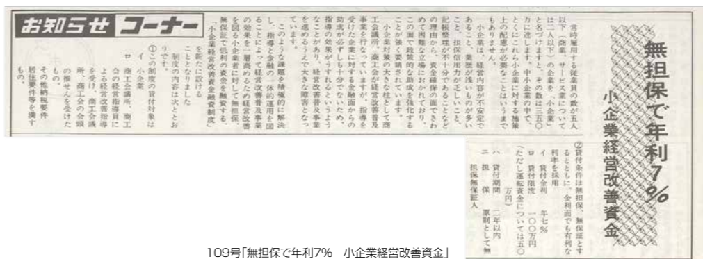
109号「無担保で年利7% 小企業経営改善資金」

従業員が5人以下の小企業は、日本に 350万社に達します。 小企業は経営内容が不安定であること、 業歴が浅いものが多いこと、担保能力が乏 しいことなどから資金確保の面できわめて 困難な立場に置かれています。また商工会 議所が経営改善普及事業を行っています が、金融面での助成が必ずしも十分ではな いことなどが大きな障害となっています。 小企業に関する課題を積極的に解決し 指導と金融の一体的運用を図ることで経 営改善普及事業の効果を高めるため、経 営改善を図る小企業に対して無担保、無 保証で低利の資金を融資する制度「小企 業経営改善融資制度」が新設されます。