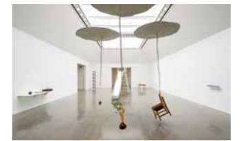
会場風景

ボール紙、発泡スチロール、石膏、針金やビニールなど、およそ彫刻らしからぬ軽い素材で、浮遊感溢れる「彫刻」を制作してきた現代美術家・今村源。本展は、1980年代前半より京都を拠点に制作活動をスタートさせ、いずれにも寄らない独自の哲学的作風で早くから注目を集めてきた今村の10年ぶりとなる美術館での個展です。ぜひご来場ください。