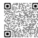
商工会議所サイバーセキュリティお助け隊サービス